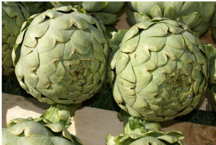
« Artichaut du Roussillon » Calico - crédit photo : Chambre d'agriculture des Pyrénées-Orientales.

La Commission européenne a enregistré la dénomination « Artichaut du Roussillon » en Indication géographique protégée (IGP) par règlement paru au Journal Officiel de l'Union européenne le 31 juillet 2015.