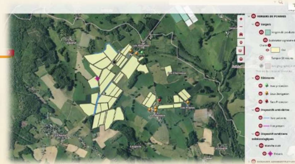
Portail cartographique grand public https://urlr.me/MkRSQ

19 manches à air implantées sur le territoire ⇒ dispositif permettant de rassurer les riverains sur la vitesse du vent et outil de gestion des interventions pour les producteurs