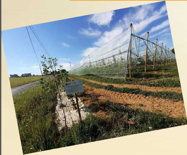
Haies anti-dérive (protection + préservation de la biodiversité) ⇒ 40 km plantés à ce jour