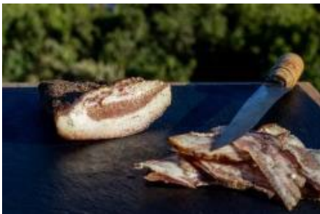
Bulagna de l'Île de Beauté