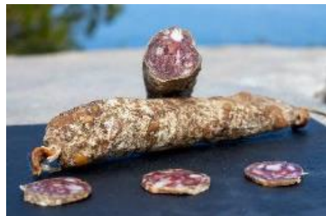
Saucisson sec de l'Île de Beauté