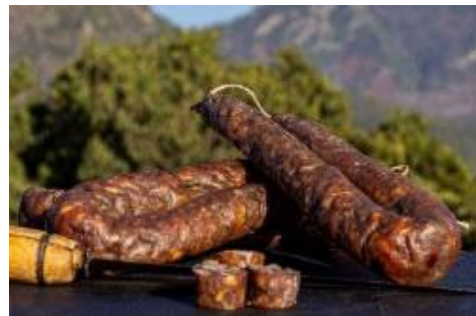
Figatelli de l'Île de Beauté