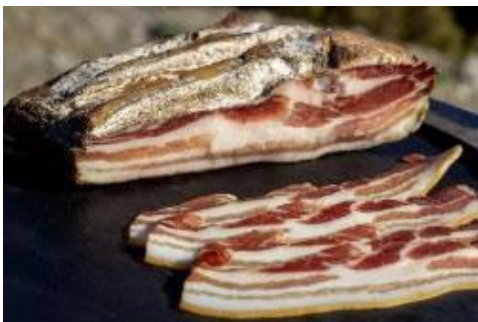
Pancetta de l'Île de Beauté